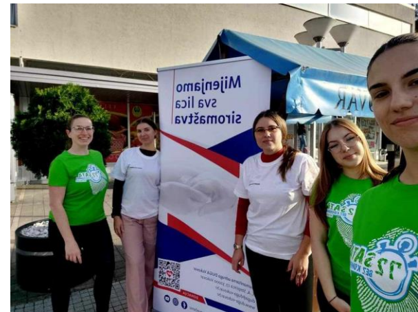
Volonterska akcija - 72 sata bez kompromisa