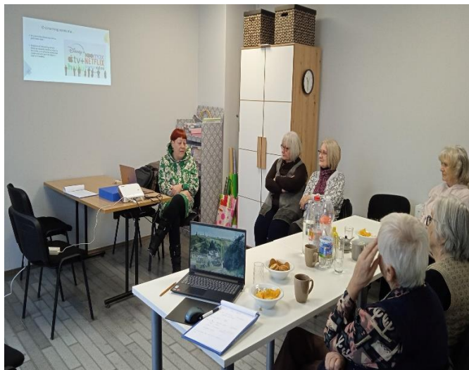
Učimo: Edukativna radionica – Prava potrošača