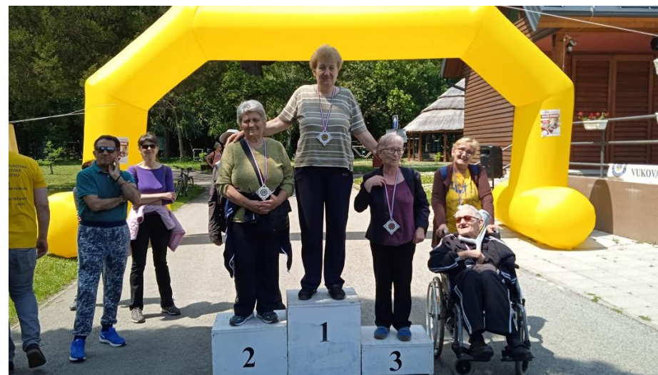
Sudjelujemo i osvajamo medalje-6. Vukovarski kros Hrvatskoj na ponos: Trčim i pomažem.