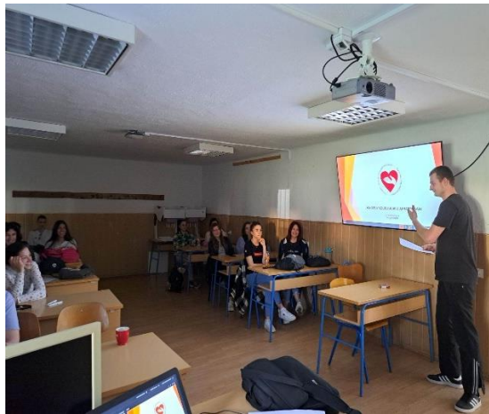
Aktivnosti u sklopu projekta - TEACHgiving