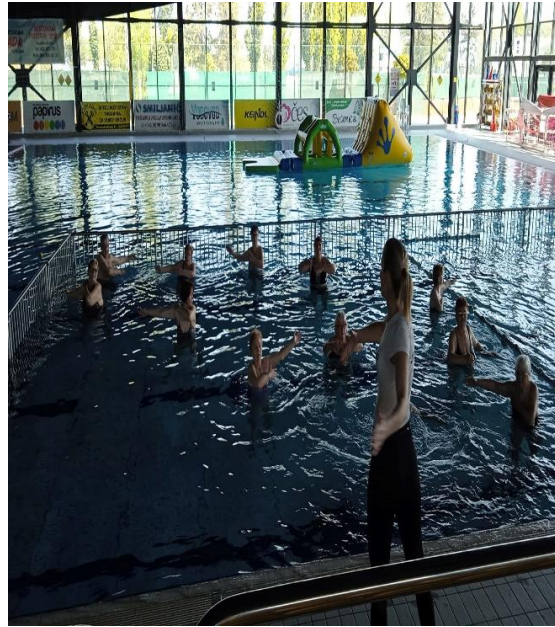
Vježbamo: Aqua aerobik – Sportski objekti Vukovar