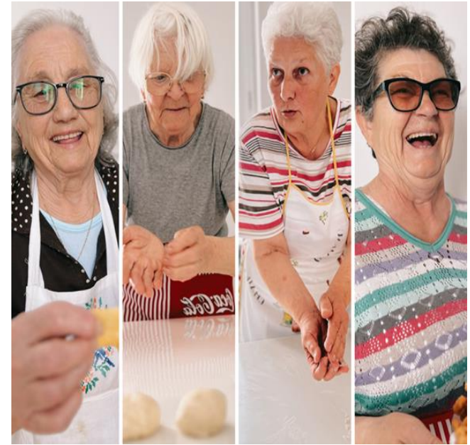
Izrađujemo domaće kolače i uživamo

PROGRAM ZA AKTIVNO I SRETNO STARENJE sufinancira Ministarstvo rada, mirovinskog sustava, obitelji i socijalne politike u iznosu od 28.160,00 € / 212.171,52 kn u periodu od 01.01.2023. do 31.12.2024. godine