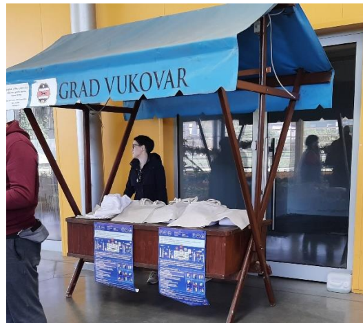
Promocija projekta – Moje zdravlje, moje pravo