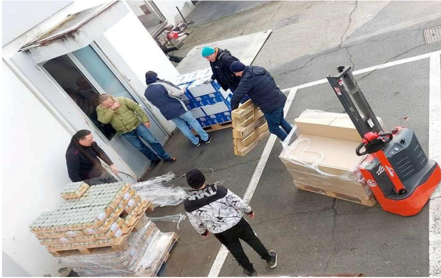
Socijalna samoposluga – zaprimanje donacija