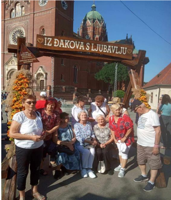
Putujemo: Izlet u Đakovo