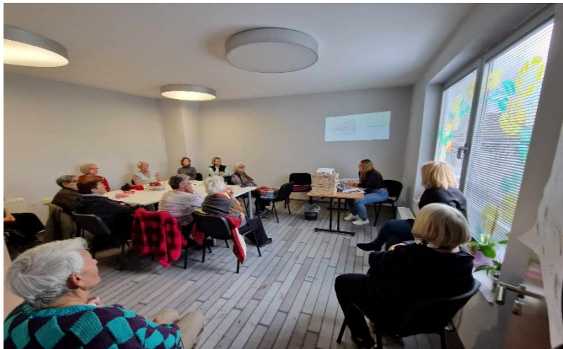
Radionica – Uvod u volontiranje

Prema grčkoj mitologiji, Iris je bila boginja duginih boja koja je putovala između neba i zemlje, spajajući nebo i zemlju svojim svjetlucavim lukom. Ona je predstavljala vezu između bogova i ljudi te je bila poznata po svojoj ljepoti i snazi. Osim grčke boginje, Iris je ime koje se povezuje s prekrasnim cvijetom koji dolazi u različitim bojama. Cvijet Iris simbolizira vjeru, nadu, mudrost i hrabrost te se često daje kao dar u znak podrške ili prijateljstva.